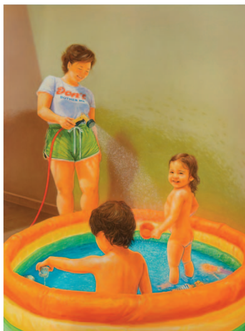
Don't Bother Me, 2025 Foto: Filipe Berndt