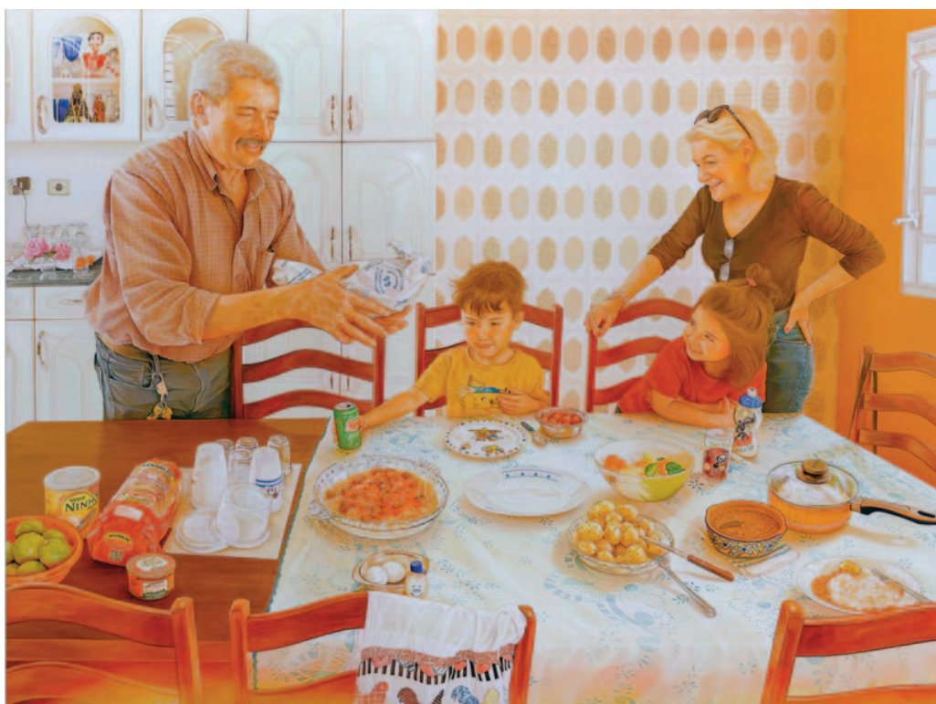
O melhor almoço do mundo, 2024-2025