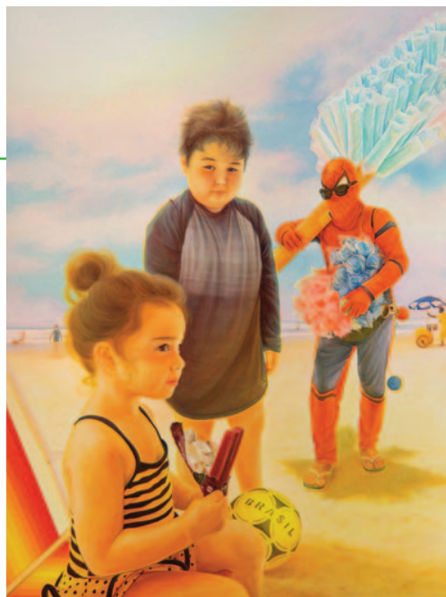
A nuvem tem gosto de algodão doce, 2025

Formou-se bacharel em Artes Plásticas em 2010 e cursou pós-graduação em História da Arte entre 2014 e 2015, ambas pela Fundação Armando Alvares Penteado (FAAP), em São Paulo. Recentemente teve sua trajetória reconhecida ao ser contemplada no 8º Prêmio Artes Tomie Ohtake (Instituto Tomie Ohtake, São Paulo, 2022), no 32º Programa de Exposições do Centro Cultural São Paulo (CCSP, 2022) e ao receber o 11º Prêmio DASartes (Revista DASartes, Rio de Janeiro, 2021).